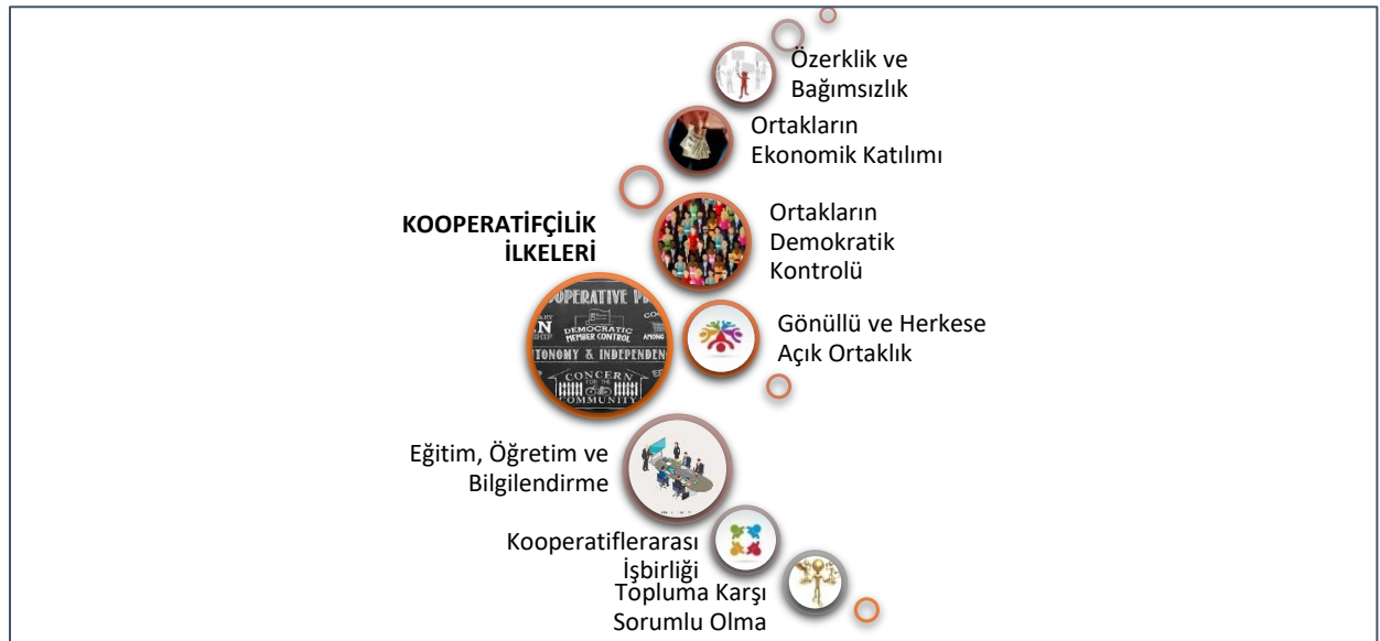
Şekil 1. Kooperatifçilik İlkeleri

ICA tarafından Kooperatif Kimlik Bildirgesi adı altında toplanarak, 1995 yılında yeniden gözden geçirilen ve son haline getirilen kooperatifçilik ilkeleri aşağıda sunulmuştur (ICA Co-operative Identity Statement; Polat, 2017):