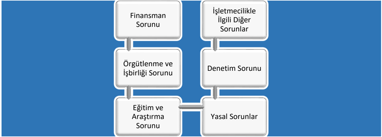
Şekil 3: Kooperatiflerin Sorunları

beklenen sonuçlar elde edilememiştir (Polat, 2017). Türkiye’de kooperatiflerin önemli sorunları Şekil 3’te görüldüğü gibi temel olarak altı ana başlık altında toplanabilir: