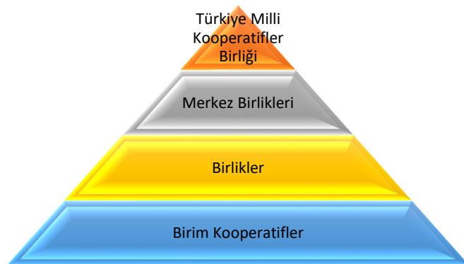
Şekil 4: Kooperatiflerde Üst Örgütlenme

Kooperatiflerde örgütlenme, ortaklık kültürünün gelişmesi açısından ele alınabileceği gibi, kooperatifler arası örgütlenme açısından da ele alınabilir. Kooperatifler yatay ya da dikey olarak örgütlenebilirler. Türkiye’de birim kooperatifler illerde veya bölgelerde birliklerini, birlikler merkez birliklerini, merkez birlikleri de en üst nokta olan Türkiye Milli Kooperatifler Birliği’ni oluşturarak üst örgütlenmeyi gerçekleştirirler.